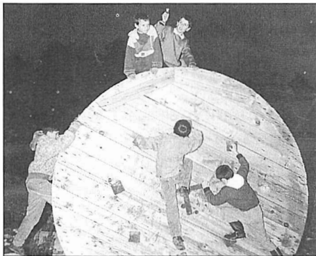
Ez dute etorkizun erraza Kroazian errefuxialutako haur bosniarrek.

Frantzia osoa zeharkatu dugu. Autobusa martxan zela, TTTSko errefuxiatuei erositako (patuko)-en banaketa egin dugu. Ez dute diru sarrera handirik izan gurekin, baina ondo etorriko zitzaizen material berria erosi eta lanean jarrai-