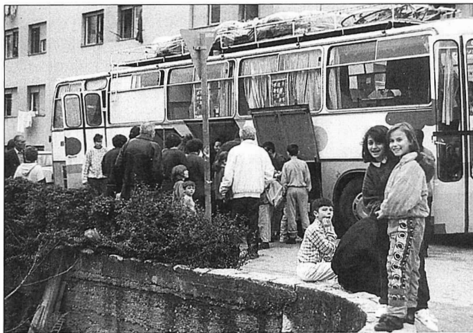
Errefuxiatu eremu bateko bizilagunak Tolosatik bidalitako janaria jasotzen.