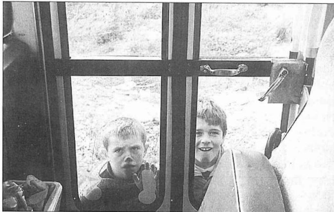
TTTSko bi haur errefuxiatu Nairobitarraren ate hondoan

Arratsaldean, euren babespean dagoen TTTS errefuxiatu eremuaren ingurura eraman gaituzte SOS Balkanesekoek. 7 kilometro ingurura dago eremu hau, Stobrec herritik getu. TTTS izeneko garraio zentro handi baten ertzean kokatua dago, zentro hori eraiki zuten langileentzat prestatutako barra-koietan. Oso metro karratu gutxitan