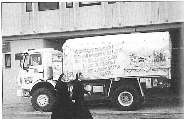
ARMAK KONBOI KATOLIKOAN. Argazkian, abenduaren 12an Splitetik irten zen 'Bijeli put za Nova Bila' konboiko kamioietako bat. 'Bidaia zuria' izena zuen arren, Armijako begiraleek 5.000 detonagailu eta 10.000 fusible lehergailudun aurkitu zituzten joan den astelehenean, abenduak 20, Kroaziako Karitasek eta frantziskotarrek Bosnia erdialdera bidaratutako konboi honetako kamioi batean. J.L.Z.

Etxe atarian bertan sekulako ikuskaria izan dugu goizean goizetik: 140 kamioik osatutako konboi handia genuen Nairobitarraren ondoan. 'Bijeli put za Nova Bila' ('Nova Bilarako bidaia zuria') da Splitetik Bosniako zenbait hiri-