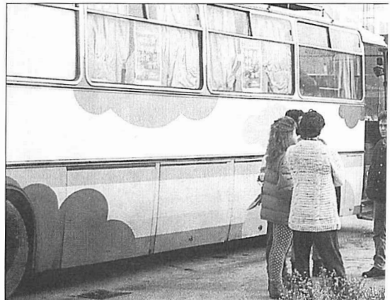
Berrogei ordu inguru egin zituen Nairobitarrek Tolosatik Rijekarako bidean. J.L.Z.

Egunez egun kontatuko ditut, egunkari moduan eta ahalik eta zintzo eta egokien, bidaia honetan ikusi, entzun, bizi eta sentitutakoak, inoiz Xk nire lana irakurriko balu haserreberdik aurkituko ez lukeelako esperantzan.