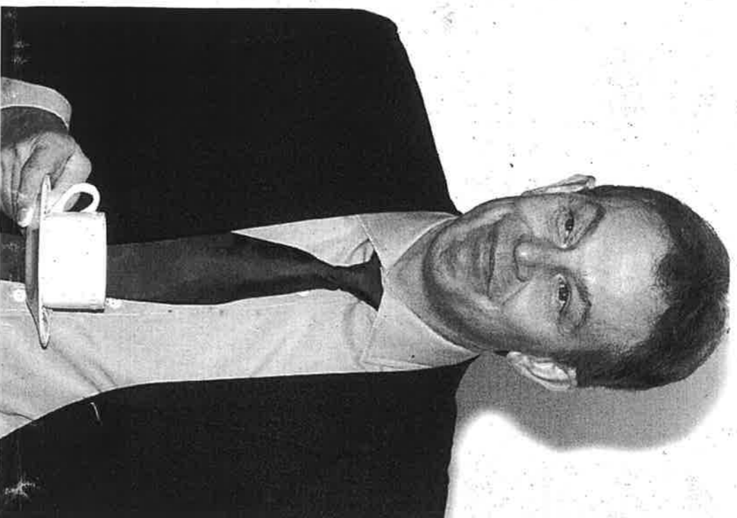
TONY BLAIR Erresuma Batuko lehen ministroa.

Banaketa hesiak gero eta ghetto handiagoetan sartuko ditu palestinarrok; haien ekonomia eta bizibaldintzak gehiago estutuko ditu. Kortan usteltzen utziko ditu. Banaketa hesia sionismoaren porrotaren adierazgarria da, eta ez du konponduko auzia; ez ditu hobetuko israeldarren eta arabiarren arteko harremanak. Aste honetan israeldarrek Ramalan egindakoak are gehiago okertu du giroa. Hor ere nagusiatzen indarra erabili du Israelrek. Far Westeko film batean balitz bezala, ia 9 milioi euro lapurtu ditu Armadak hango banketxe-tatik, dirutza hori ekintzaille palestinarentzat zela argudiatuta. Soldaduek banketxeetan sartu dira, kamerak zakuakin estali, eta lanari ekin. Guztira lau lekutan izan dira lapurretak: Arab Bank-eko bi sukurtzaletan, Cairo Amman Bank-en eta International Palestine Bank-en. Palestina-ko lehen ministro Ahmed Kureiak mafiaren jarduerekin konparatu du israeldarren jokoa. Dena terrorismoari aurre egiteko izan da, antza. Munduan inork ez du ezer esan; badirudi legezkoa dela. Manhattango