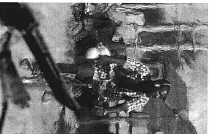
HERRITAR BAT , sulan dagoen barrikada baten ondoan, Gonaivesen.

BAGDAD • Ekialdeko infernuko atea. AEBak kontinente berrian indepententzia lortu zuen lehen estatua izan zi-