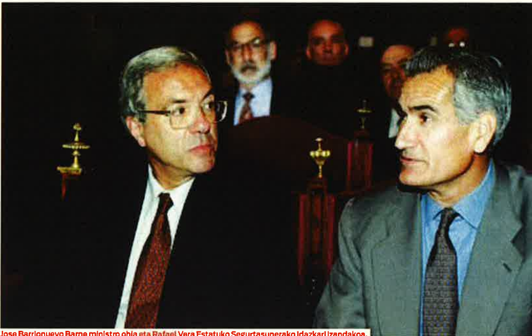
Jose Barrionuevo Barne ministro ohia eta Rafael Vera Estatuko Segurtasunerako Idazkarlari izandakoa.