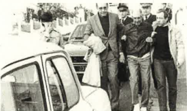
Segundo Marev, GALEk bahituta 10 egun egin ostean. «GALen egia osoa argitu behar da, biktimek sufritzeari utz diezaloten», esan zuen bere kasuaren epalketan. DANIEL VELEZ