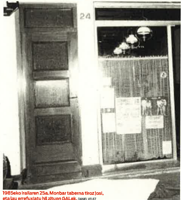
1985eko irailaren 25a. Monbar taberna tiroz josi, eta lau errefuxiatu hil zituen GALek.