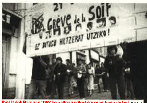
Iheslariak Baionan 1984ko irailaren egindako manifestazio bat. D. VELEZ

Arrats apalean, iheslari taldeak ohikoak ziren alde zaharretan, Baionan bereziki. Asteburuetan, haiek ikustera zetozen senide eta lagunak handitzen zituzten taldeak. Poteoa existitzen ez zen hiri horretan, 10, 20, 30 pertsonak osatzen zituzten taldeak aruntak ziren asteburuetako poteoetan. Karririk giroa bestelakotzen zuen. Lapurdi barnealdeko, Nafarroa Behereko eta Zuberoako jendea ere erakartzen zuen giroak. Manifestazioen aitzakian, edota egun-