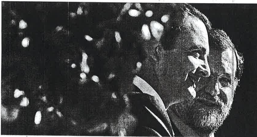
JOSE LUIS RODRIGUEZ ZAPATERO eta Mariano Raxoi, atzo, Mocloako Jauregiko lorategietan, bilera hasi aurretik.

ETArekin konpromisorik ez duela hartu hitz eman dio Espainiako gobernuburuak, PPko buruzagiak esan duenez