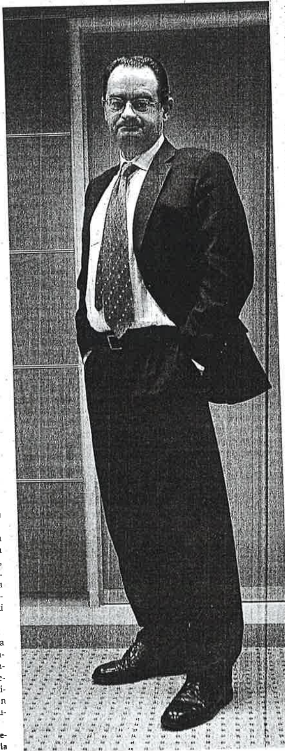
RAUL BOGADO / ARGAZKI PRESS

Ez dirudi horretan ari direnik. Alderantz, PP baina gogorrago ari direla erakutsi nahian bezala dabil PSOE.