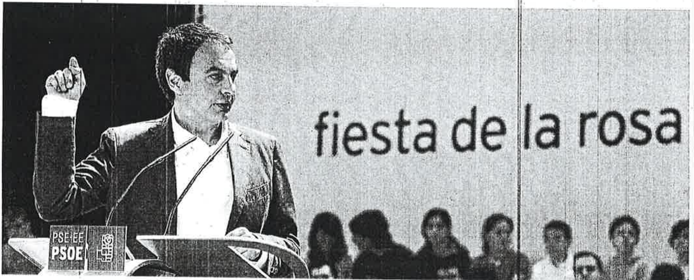
Jose Luis Rodriguez Zapatero Espainiako Gobernuko presidentea, herenegun Barakaldon, PSE-EEren Arrosaren Festan.

BIKTIMAK. Egitasmo berri bat ere aurkeztu zuen Rodriguez Zapaterok Barakaldon: «Terrorismoaren biktimak» Konstituzioaren hitzaurrean aipatzeko proposamena aurkeztuko duela iragarri zuen.